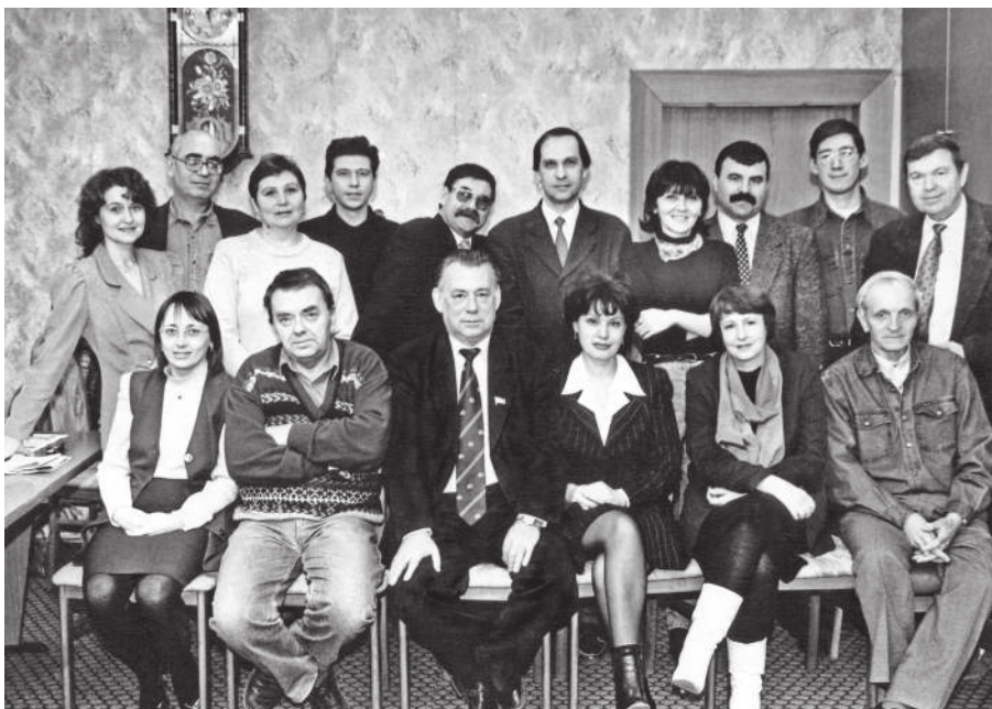
Коллектив редакции, 2002 г.