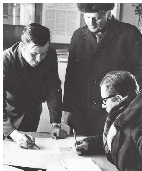
Будни редакции, 1972 г.