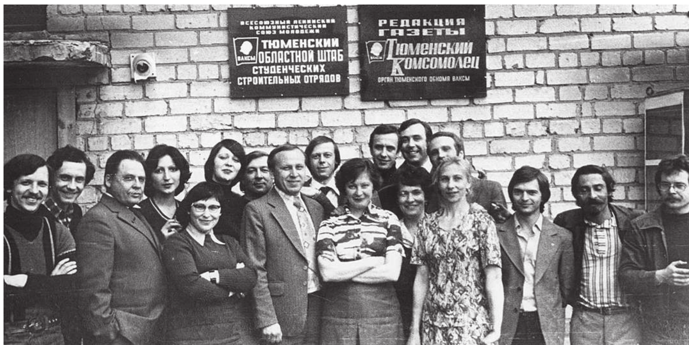
«Тюменский комсомолец», начало 80-х.