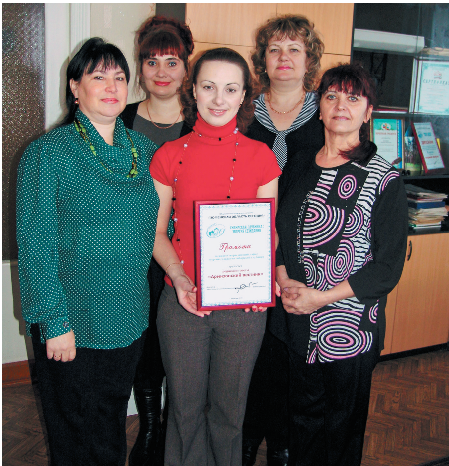
Творческий коллектив «Армизонского вестника» с грамотой за «Сибирскую глубинку». 2010 г.

Почетный нефтяник, лауреат премии им. Виктора Муравленко, «Отличник кинематографии СССР». Награжден Почетными грамотами Госкино СССР, Госкино РСФСР, ряда киностудий страны. Обладатель Почетного звания «Легенда тюменской прессы» (2003).