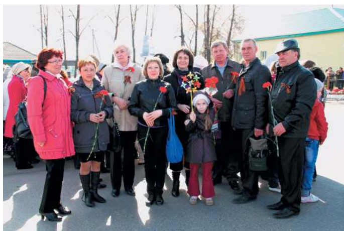
На параде в День Победы, 9 мая 2012 г.