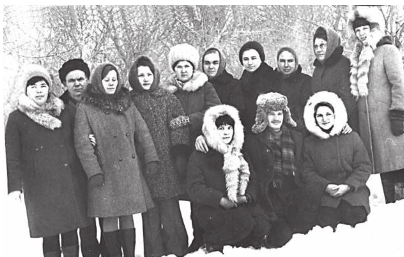
Коллектив редакции газеты «Слава труду» и типографии, 70-е годы.

Да, это было золотое время. Мы были причастны к важному историческому делу, мы сами – живая история. Спасибо судьбе за это.