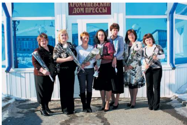
Праздник в газете: открыт Аромашевский Дом прессы, 8 марта 2011 г.

Власти начинают обращать пристальное внимание на воспитание молодого поколения, па-