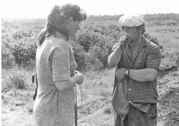
Диалог журналиста с героем будущей публикации.