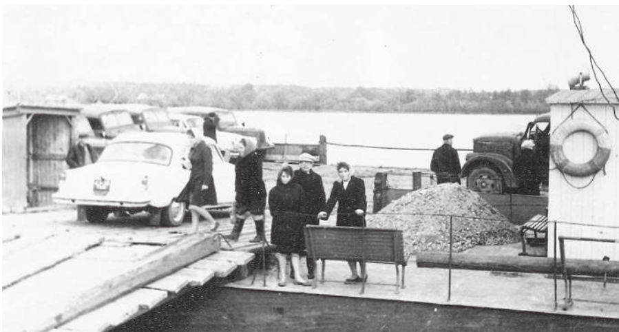
Сотрудники редакции едут в командировку за реку.