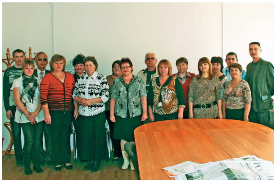
Коллектив редакции. 2012 г.

Не берусь сравнивать эти показатели с нынешними, но пола-