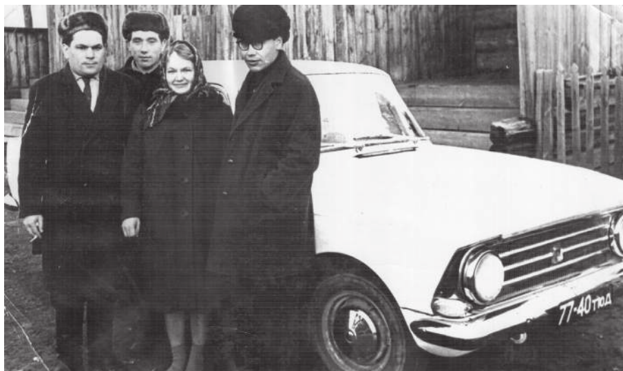
Всеобщая радость: редакция получила долгожданный автомобиль. 1968 г.

Во второй половине 60-х начала использоваться в работе с селькорами активом очень эффективная форма – встречи с читателями. Ежегодно в акти-