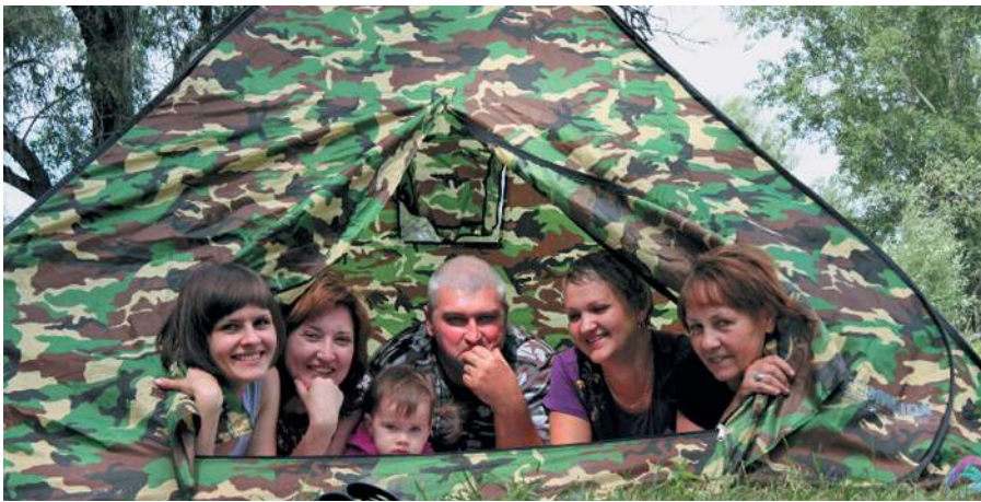
Традиционный выезд на природу.