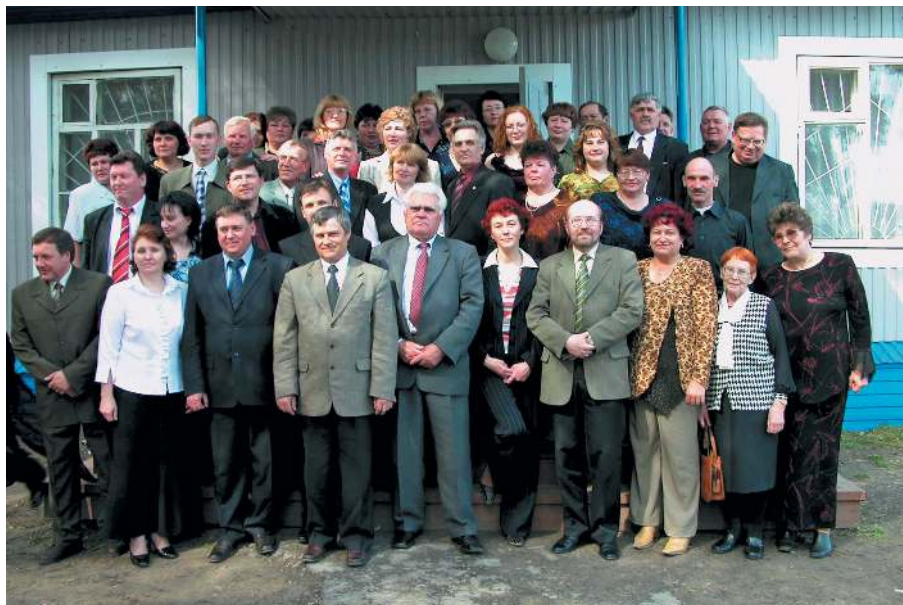
Юбилей газеты. 2005 г.

Любой журналист, если спросить у него, что есть районная газета, споёт свою песню на эту тему. Песни будут разные и