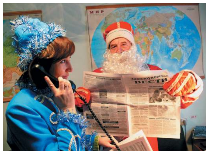
В разгаре подписная кампания.