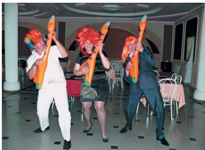
Юбилей газеты. 2010 г.