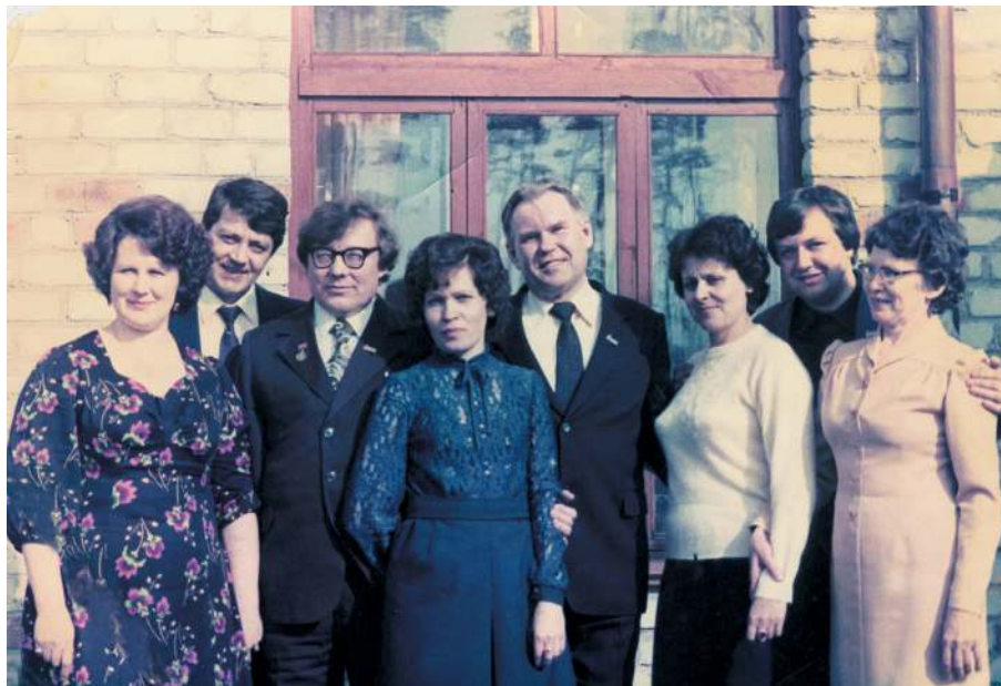
Состав редакции в 70-е годы.

Центрсоюз и Облпотребсоюз дали указание местным торговым организациям о том, что товары широкого потребления (мануфактура, одежда, обувь и т.д.) в первую очередь будут забрасываться в те населённые пункты, которые являются передовиками