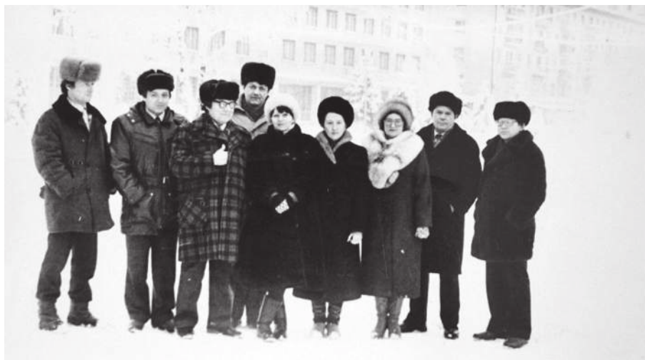
Коллектив редакции еще «Советского Зауралья». 1988 г.