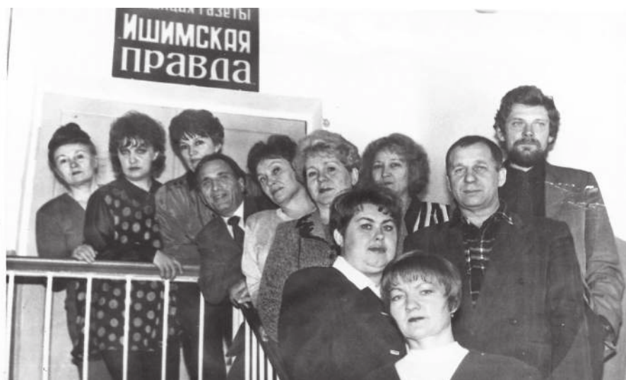
Коллектив «Ишимской правды» накануне 80-летия газеты. Ноябрь, 1998 г.