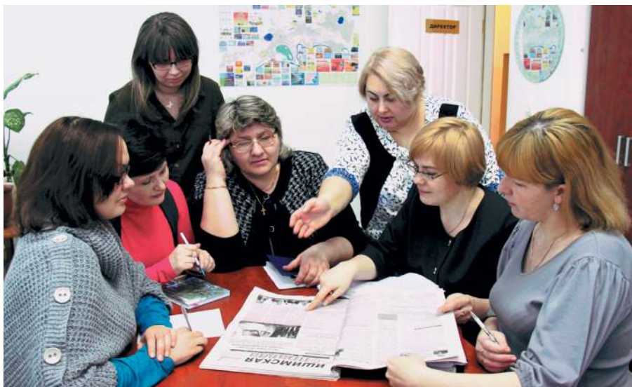
«Ишимской правде» – 85 лет. Ода в честь юбилея газеты в исполнении коллектива сотрудников. 2003 год.