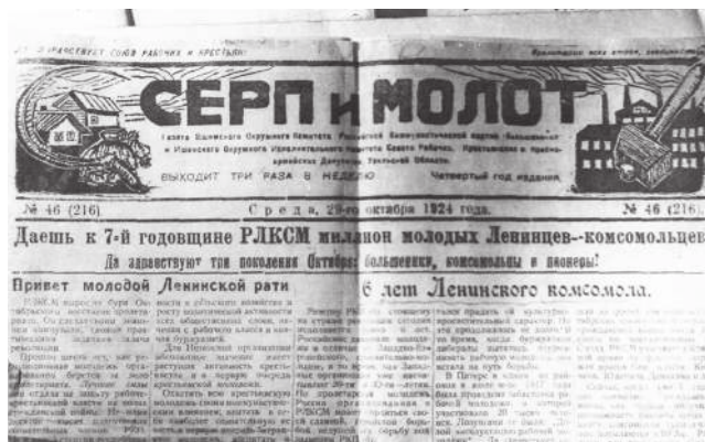
Первая полоса газеты «Серп и молот» за 29 октября 1924 года.