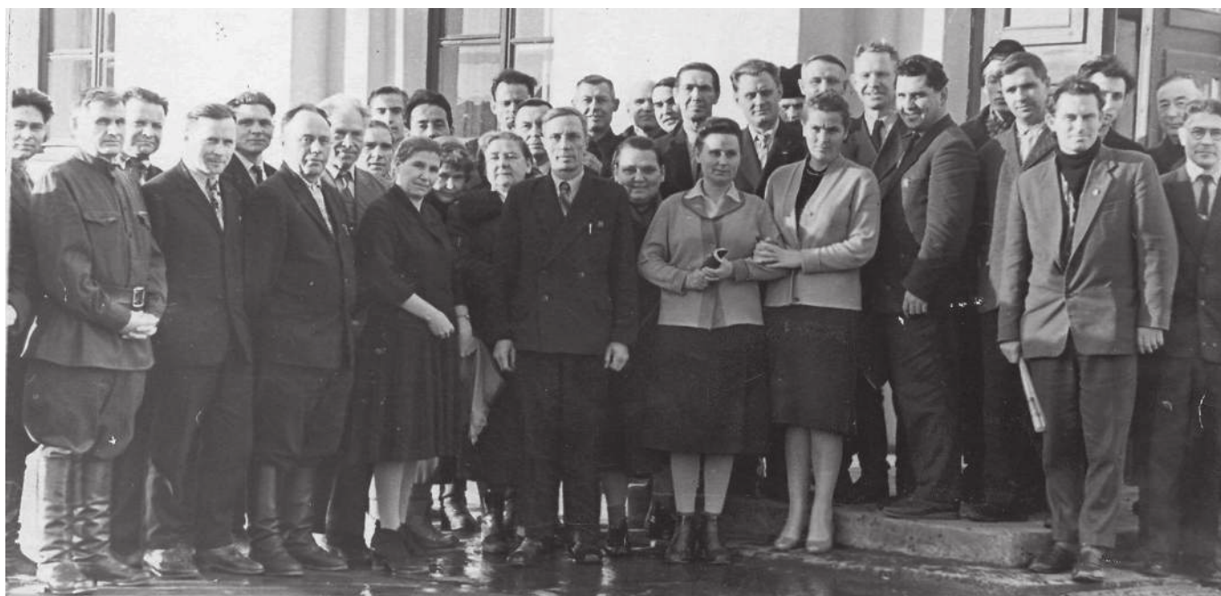
Актив газеты «Ишимская правда». Совецание рабкоров. Ноябрь, 1964 год.

В любой газете всегда живая, деловая обстановка, сближающая сотрудников. В довоенные и первые послевоенные годы было, конечно, немало трудностей. Первая радость: молодым сотрудникам