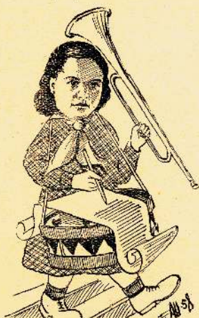
Любит пионерню и галотуках красных. Пишет о ней и пишет прекрасно.