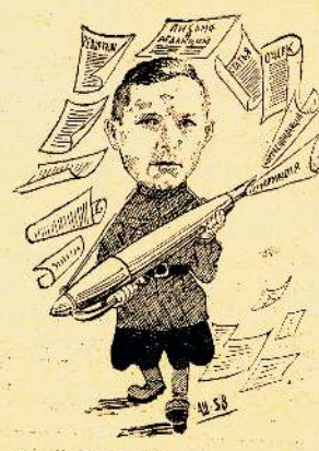
Часто, дельно, остро Пишет его перо. Пишет без лишней «воды» – Селькоровские труды.