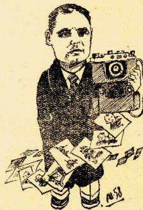
Он использует ретиво Зоркость, меткость объектива. Фотографий масса этих Так нужны, ценны в газете.