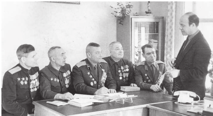
Омутинцы – участники Великой Отечественной войны в гостях у «Ленинского знамени». Встреча с редактором.