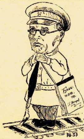
Путеец, движенец, осмотрщик вагонов – Герой его газетных колодок.