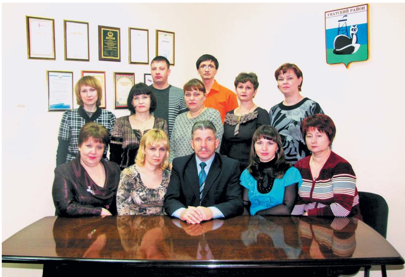
Коллектив редакции, 2012 г.