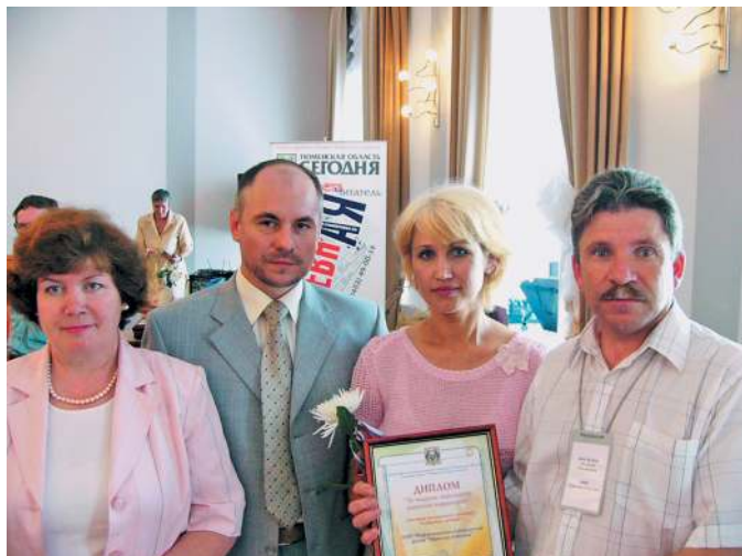
Журналисты «Уватских известий» с членами жюри творческого конкурса «Сибирская глубинка».

Деятельность информационно-издательского центра «Уватские известия» отмечена грамотами и благодарственными письмами Правительства Тюменской области, различных департаментов, администрации Уватского района. Приложение к газете «Вестник Губернаторской