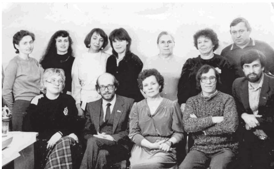
Сотрудники «Коммуны», 1987 г.

Районная газета, каких сотни и тысячи в огромной стране, – для нас она была единственной в своем роде, потому что находилась ближе всех к нашей жизни, к нашим делам и заботам. И сегодня мы, журналисты, и вы, читатели, продолжая работать и общаться друг с другом под новым именем нашей газеты, вовсе не отрекаемся от прошлого, уподобляясь Иванам, не помнящим родства.