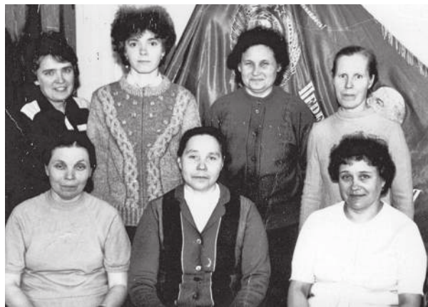
Коллектив Уватской типографии. 1991 г.