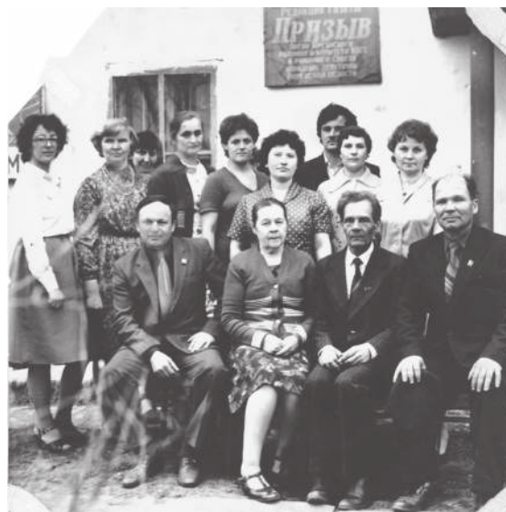
Коллектив редакции. Начало 80-х годов.