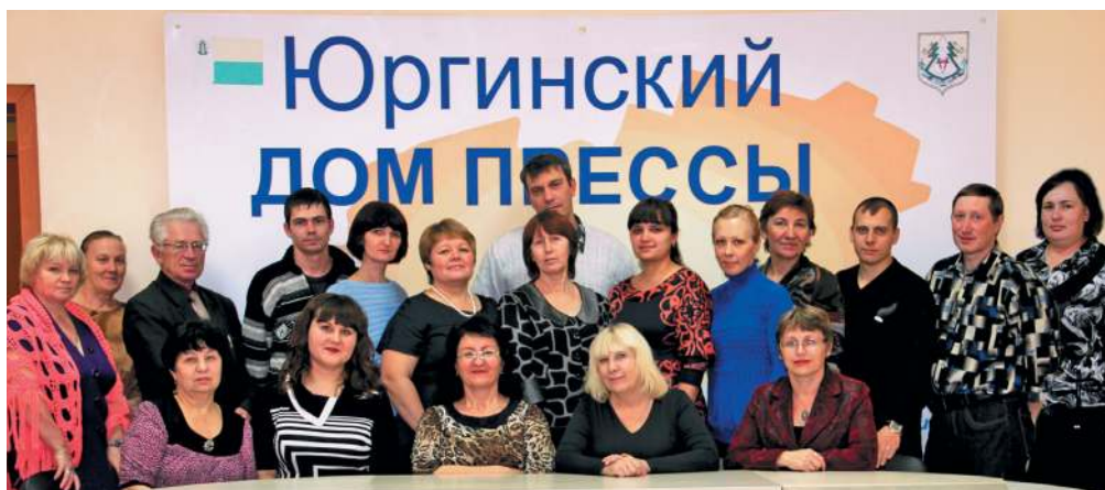
Коллектив газеты «Призыв». 2012 г.

Организаторы, лагерные службы, сами юнкоры плотно поработали три дня. Дружная команда редакции районной газеты участвовала в подготовке и проведении теоретических и практических занятий. Лагерные службы делали всё, чтобы отдых детей был здоровым и полноценным. Думается, насколько «Солнечный» полюбил юных корреспондентов, настолько они сохраняют в памяти три дня слёта, яркую частичку лета. А навыки и знания, которые они получили на смене, пригодятся им в дальнейшем.