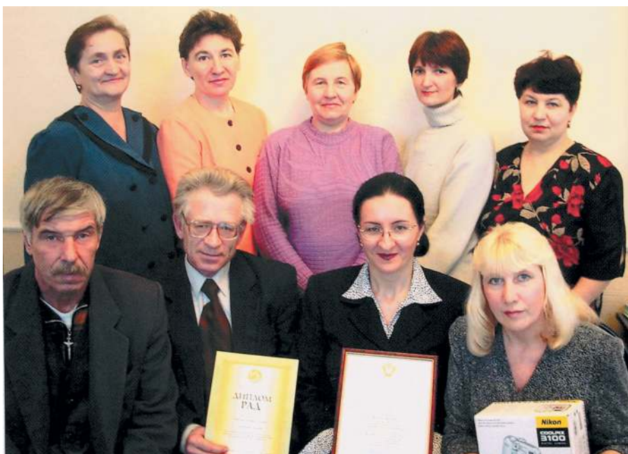
2003 год. Газета заняла третье место во Всероссийском конкурсе на лучшее освещение аграрной темы и жизни российского села.

Как-то предновогодним декабрем в Ишиме собрался первый зональный слет юных корреспондентов. И так получилось, что событие это оказалось ярким и неординарным, и его решили сделать традиционным. А в январе, на ежегодном бале прессы, он