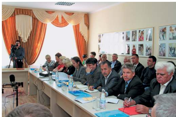
Открытие Юргинского Дома прессы.