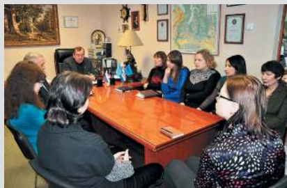
Планерка в редакции.