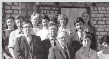
Первый состав редакции газеты с представителями горкома КПСС.

Общественно-политическая газета Ханты-Мансийского автономного округа