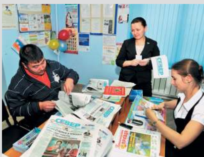
В отделе реализации «Красного Севера».