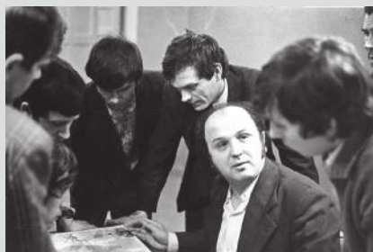
Летучка в редакции. 80-е гг.

Общественно-политическая газета Ханты-Мансийского автономного округа, г. Урай