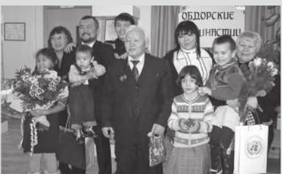
Редактор газеты Хабыча Яунгад в кругу семьи.

ее до 1961 г., когда она стала называться «Совхозная жизнь».