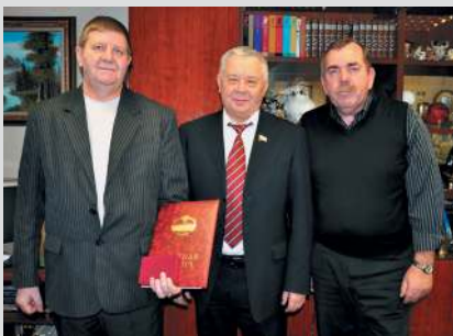
Вручение почетной грамоты Тюменской областной Думы.