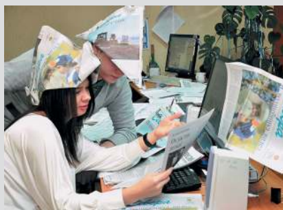
Идет работа над новогодним номером.

С 1934 года издается «Сургутская трибуна». Первые номера которой назывались «Организатор», затем газета получает название «Колхозники» (1935 г.), с 1956 года ведет жителей района «К победе коммунизма», в годы перестройки становится «Сургутской трибуной» (1990 г.).