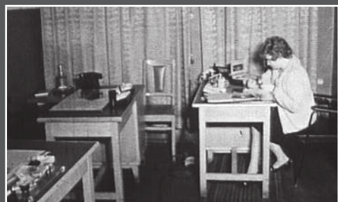
В редакции радио, начало 70-х.