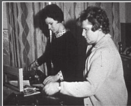
В монтажной аппаратной, 70-е.