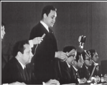
Мы делаем свое дело, оставаясь за кадром.