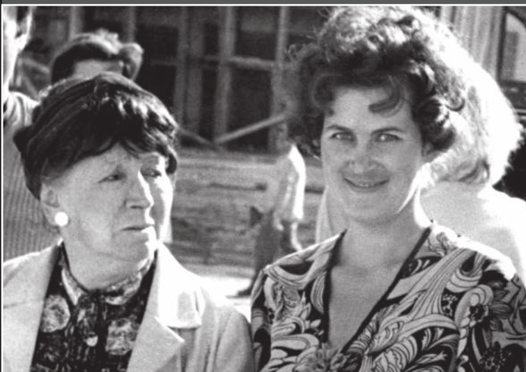
Народная артистка РСФСР Рина Зеленая и журналист Л. Марковская, 1972 г.