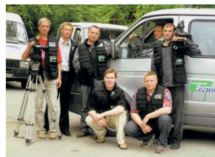
Бригада (ПТС), группа (съёмочная), смена (звукоцех) — боевые единицы ТВ

ездили перенимать опыт в соседние города (к этому времени уже появилось любительское телевидение в Омске и Свердловске). В итоге, отпочковалось новое направление в занятиях тюменского радиоклуба — телевидение. Естественно, сначала в виде забавы.