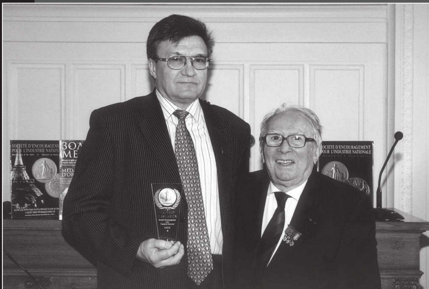
Признание в Париже