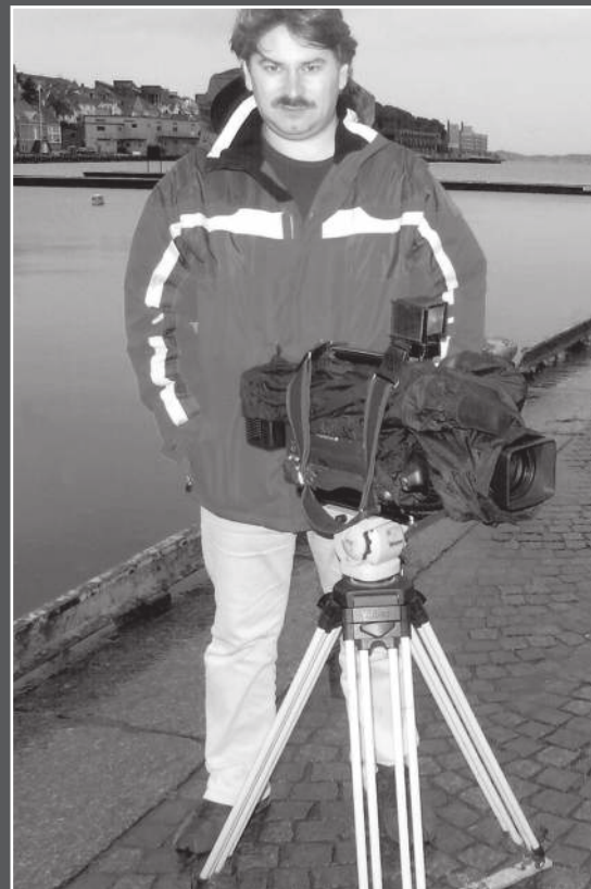
Норвежская сага Эдуарда Ульбина