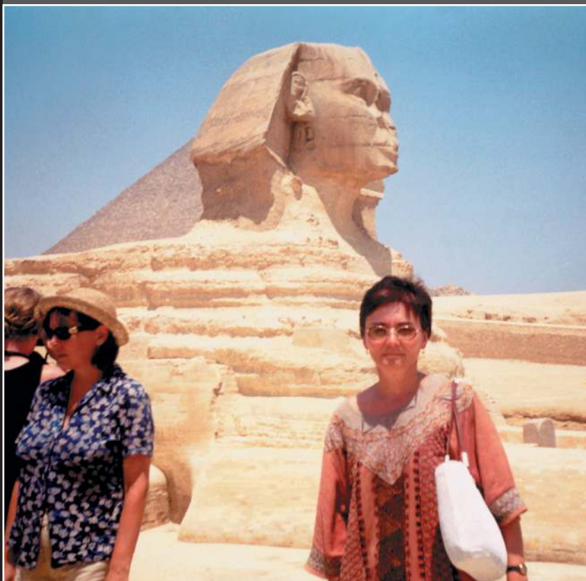
Сфинкс. Расскажем, о чем он молчит