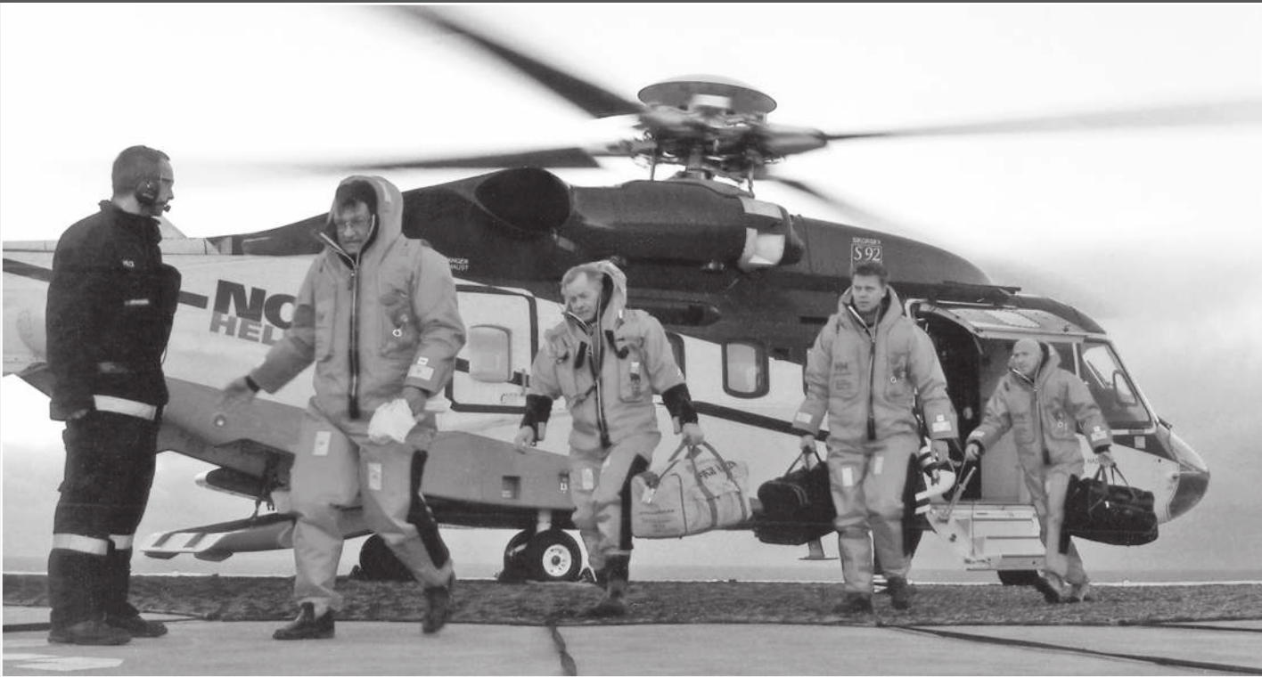
Высадка тюменского десанта на нефтяную платформу в Северном море. Норвегия