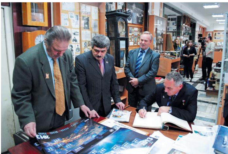
В гостях у музея Герой России космонавт А.А. Скворцов, 2012 г.

не сразу. Проводился специальный конкурс на лучшее название. Было около сотни предложений от студентов, преподавателей, выпускников, например, предлагалось назвать «Индус» – по аналогии с индустриальным институтом... Свидетельство о регистрации студенческой ТРК «Наша Юность» мы получили 20 мая 2009 года.