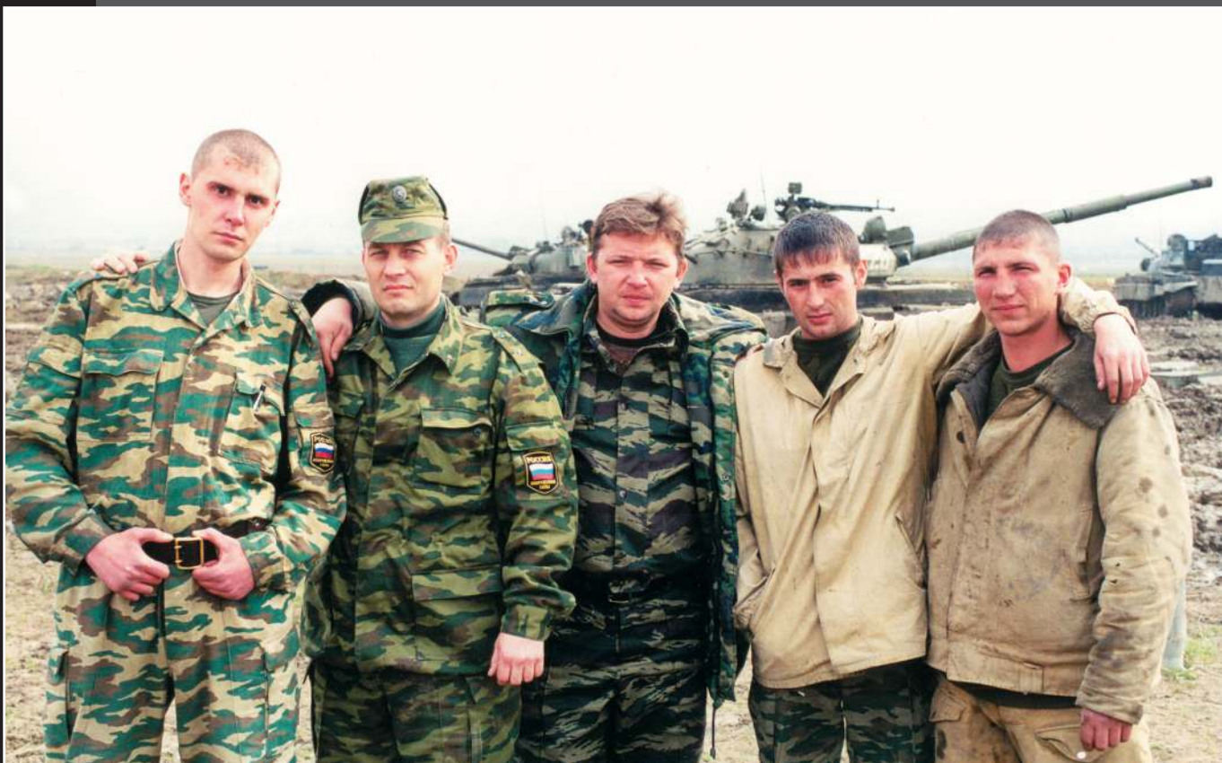
Павел Головин. Первая чеченская война глазами тюменского репортера