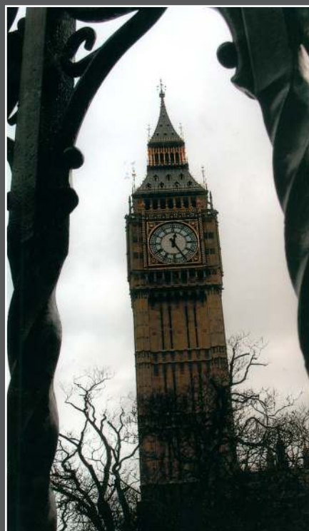
...и Лондон в нашем объективе