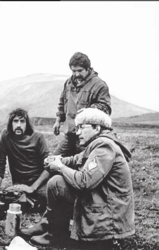
Охотники на привале. Полярно-уральский вариант