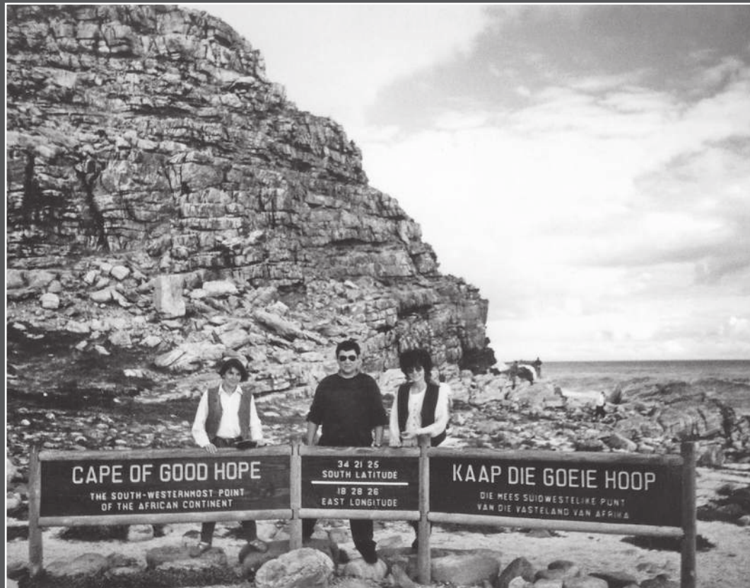
Кейптаун. Вымпел «Регион-Тюмени» доставлен на самый край земли — Мыс Доброй Надежды