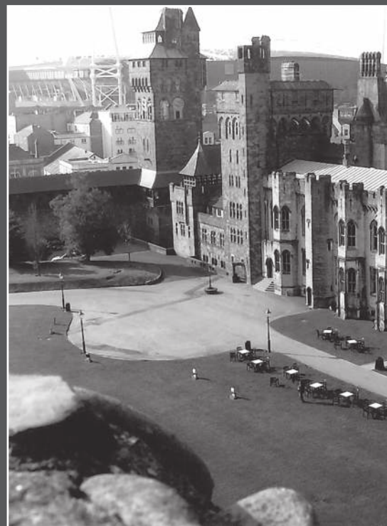
Не Эдинбург ли часом?