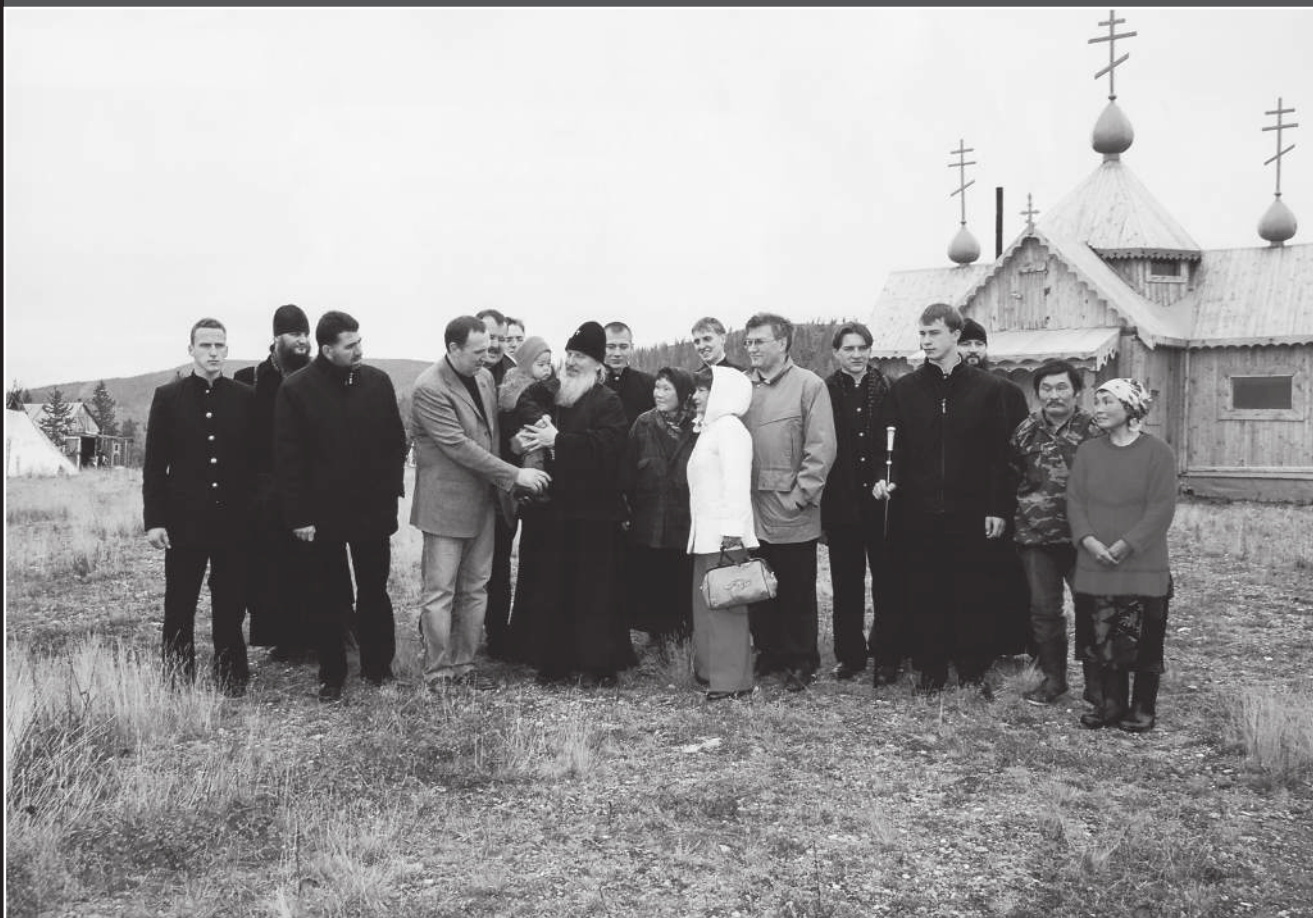
Освящение церкви на стойбище