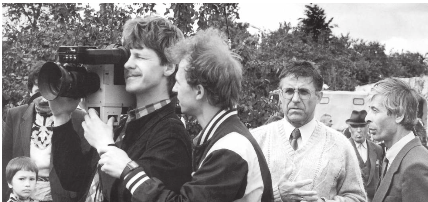
Только что пришел новый ТЖК. Как-то он сработается с нами?

на-единственная – никакой страховки. Нет уверенности, что пленка благополучно выйдет из ручной проявки, что удастся совместить изображение со звуком – так называемый синхрон... И, конечно, трудно вообразить, что ждет «Тюменский меридиан» большое и впечатляющее будущее, что станет программа долгожительницей (без малого тридцать лет) и главным летописцем истории нефтегазового комплекса Западной Сибири. В исторической ретроспективе люди, делавшие «ТМ», достойны стоять в одном строю с теми, чьи подвиги они являли миру – легендарными нефтяниками, газовиками, геологами, строителями, авиаторами... Как говорится, первее всех