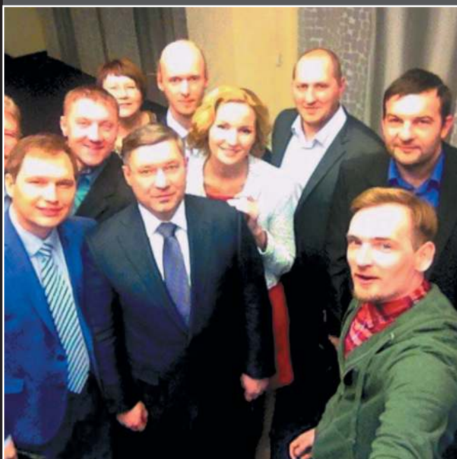
Перед прямым эфиром с губернатором Тюменской области Владимиром Якушевым