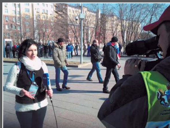
Биатлон — наше все! Гонка чемпионов в Тюмени — болельщики уже на подходе! Корреспондент телеканала «Тюменское время» Владислава Фирцева