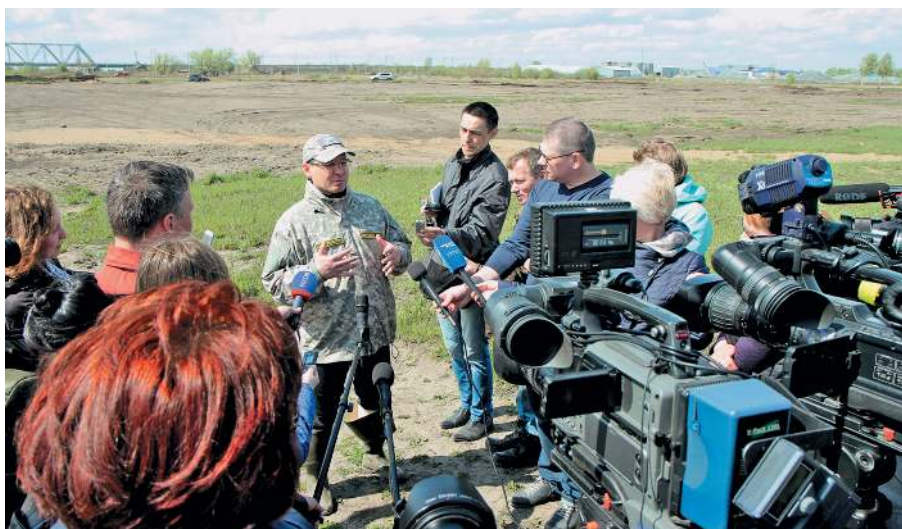
Свежие новости от губернатора Тюменской области для журналистов СМИ г. Ишима о принятых правительством области срочных мерах по борьбе с паводком (2017 год)

В 2010-м начат цикл передач «Православные бе-