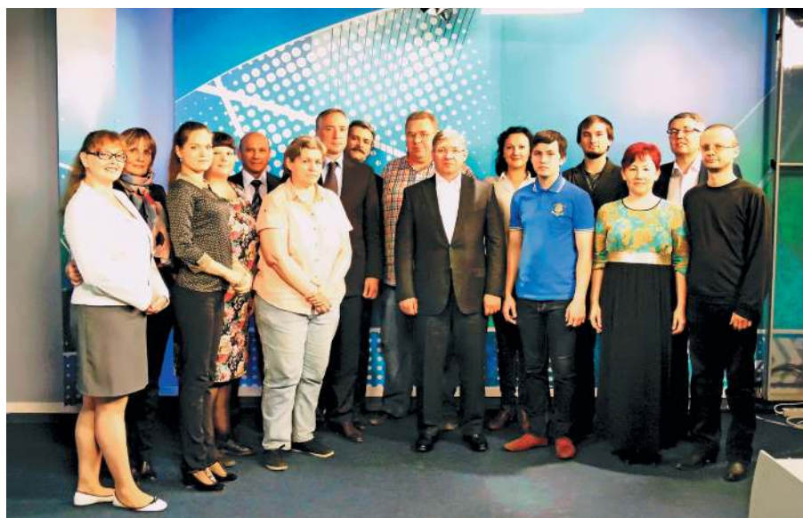
Губернатор Владимир Якушев с коллективом телеканала «Тобольское время»

1 июля 2004 года ТРВК «Тобольск» была преобразована в ООО ТРК «Тобольское время». Сетевым партнёром стал канал «РЕН-ТВ». Через год, в июне 2005-го, произведено глобальное техническое переоснащение: телевидение перешло на рабочий формат – DV-CAM. Архив