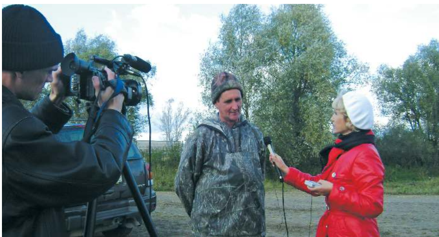
Тележурналисты на объектах нефтегазового комплекса