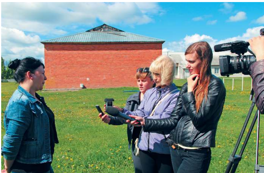
Готовится сюжет из с. Горнослинкино