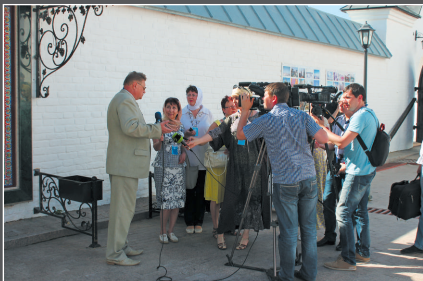
На фестивале «Православие и СМИ», Тобольск, 2014 г.