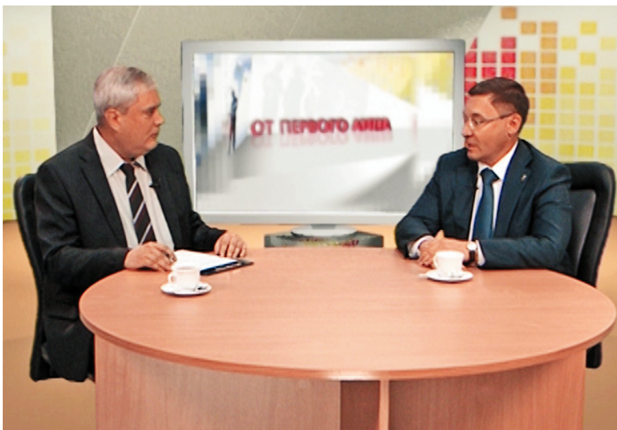
Программа «От первого лица» на телеканале «Стелла» (г. Ялуторовск и Ялуторовский район), с губернатором Тюменской области В.В. Якушевым беседует ведущий программы О. Олейниченко