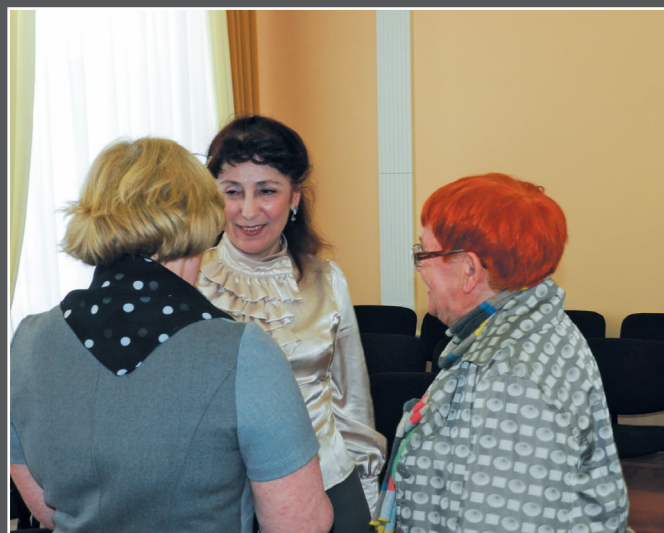
Встреча с ветеранами журналистики