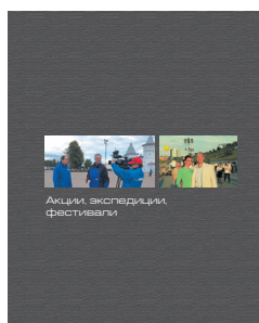
Акции, экспедиции, фестивали